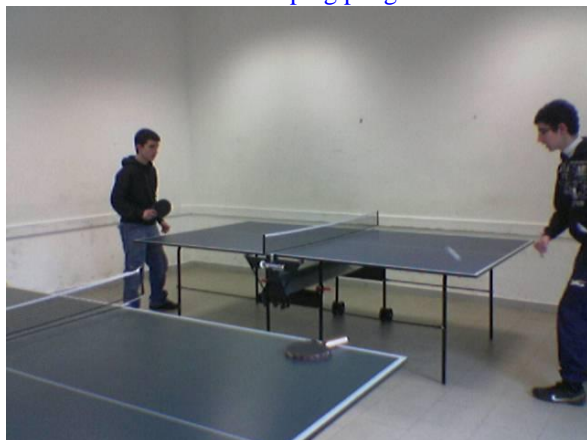
Sala ping pong