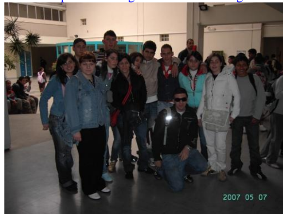
Ospiti del Collège di Colombe - Parigi